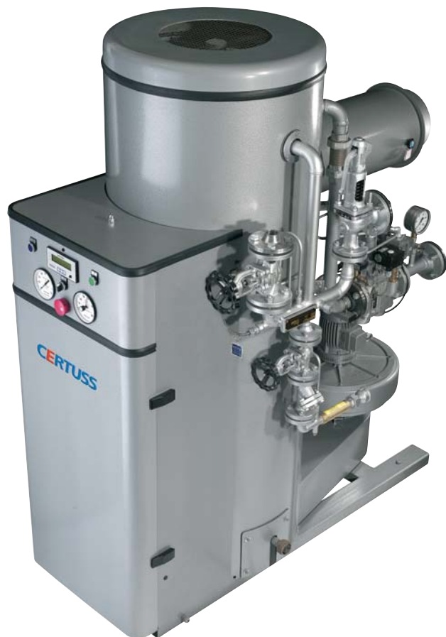
Junior SC výkon páry 80 - 600 kg/hod